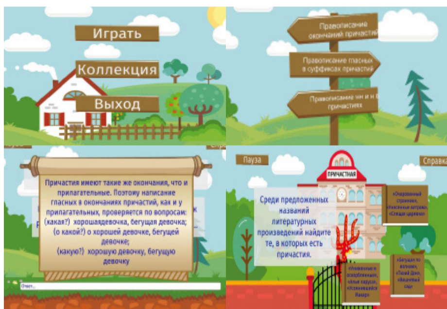
Рис. 1. Интерфейс мобильного приложения игры 11

Закрепление орфографического навыка изучаемой орфограммы становится результатом выполнения лингвистических упражнений, направленных на отработку определенных орфографических правил, а также заданий экстралингвистической направленности (см. рис. 1).